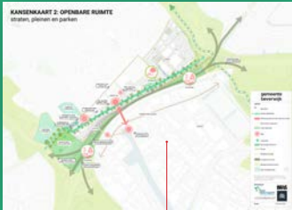
Kansenkaart 2 Spoorzone Openbare ruimte