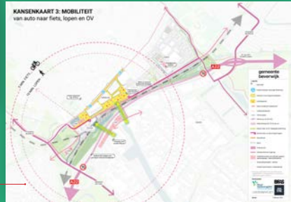
Kansenkaart 3 Spoorzone Mobiliteit